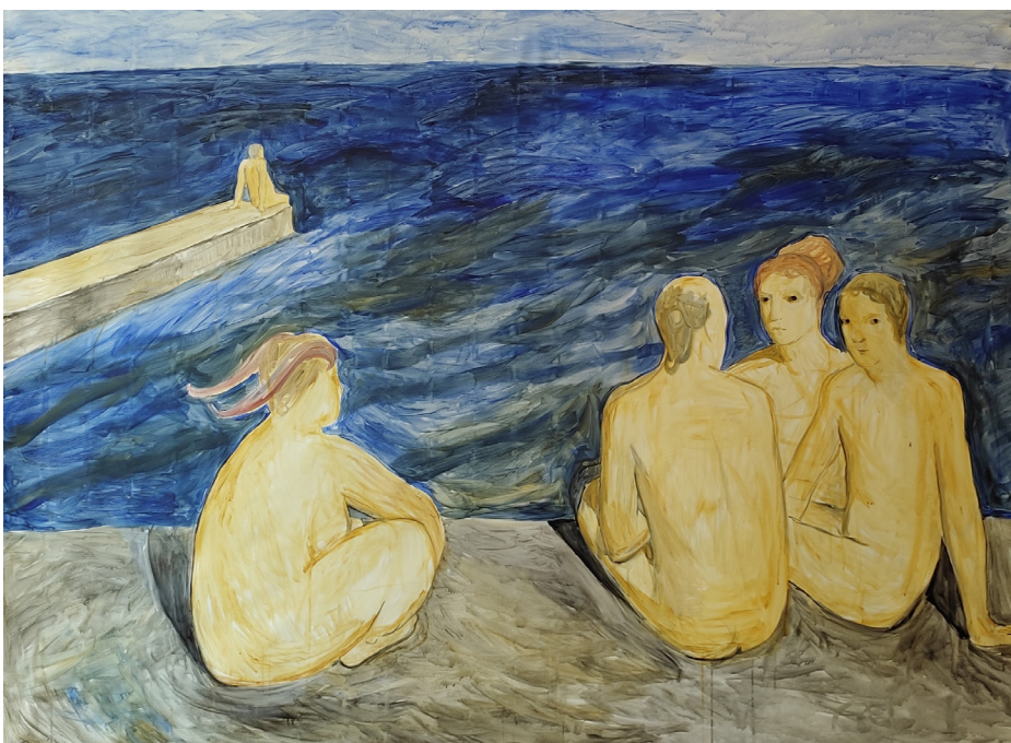
GERA ARTEMOVA Melanka , 2011 Metallischer Fotodruck / Metallic photo print 100 x 150 cm