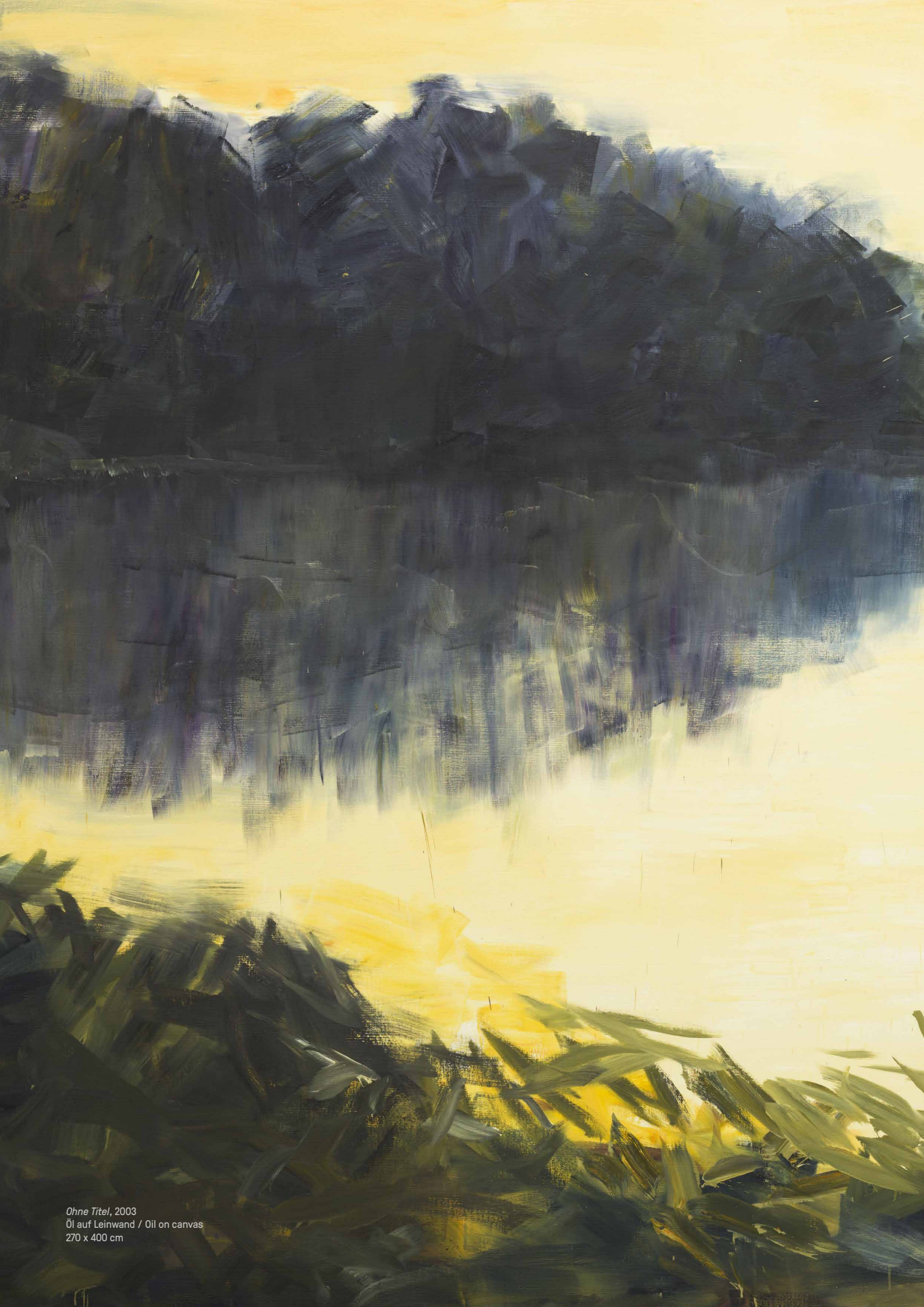
Ohne Titel , 2003 Öl auf Leinwand / Oil on canvas 270 x 400 cm