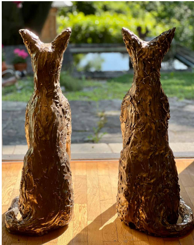
Ohne Titel , 2019 Bronze, je / each 80 x 32 x 52 cm