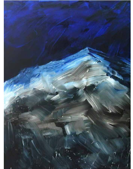
Ohne Titel , 2011 Öl auf Leinwand / Oil on canvas 218 x 170 cm

Bildgegenstand hinter den Malakt zurücktreten. „So große Leinwände musst du auch körperlich in den Griff bekommen. Auf so großen Leinwänden darfst du auf keinem Millimeter versagen“, betont Brandl. „Deshalb ist für mich ein Plan notwendig, den ich aber oft in dem Moment, in dem ich an die Leinwand gehe, schon über Bord geworfen habe. [...] Es ist also eine Mischung aus totaler Vorbereitung und der Bereitschaft, die Vorbereitung fallen zu lassen, um in etwas Unkontrolliertes überzugehen.“