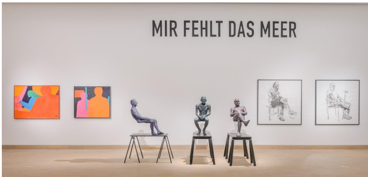
(K)EIN MENSCH IST EINE INSEL, Raumsicht, Künstlerhaus, 2021.

Die Arbeit von Pablo Chiereghin ist Teil von (K)EIN MENSCH IST EINE INSEL und ermöglicht einen ersten Einblick in die Ausstellung, in der der Schriftzug wieder auftaucht.