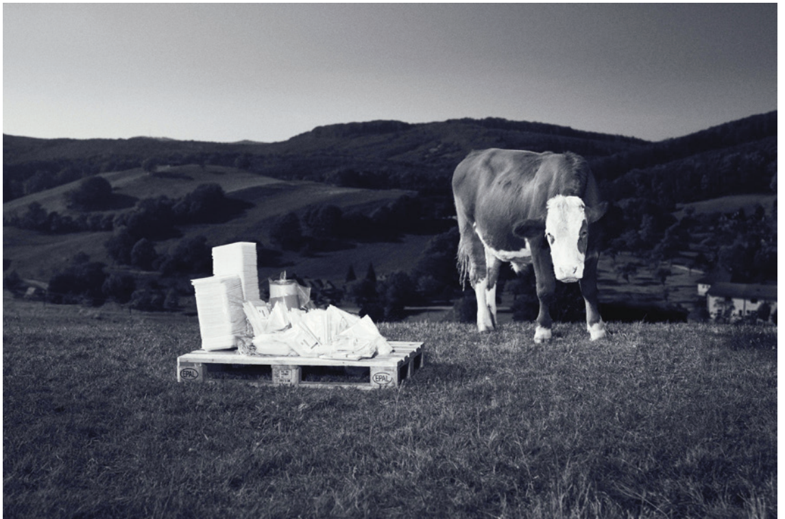
Plastic / Cow, 2020 Fotografie auf Aludipond und Objekt, 80 x 120 cm

Das Projekt PLASTIC / COW bezieht sich auf eine einfache Frage: Wie viel Verpackungsmaterial wird benötigt, um das Fleisch eines Rinds für den standardisierten europäischen Supermarktverkauf bereitzustellen?