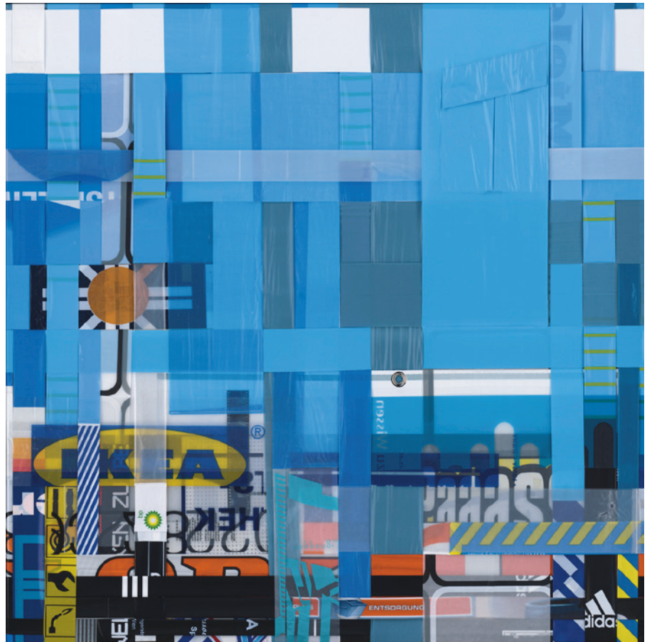
Stadtrand Wien Nord, 2017 Abfall und Verpackungsmaterial, 100 x 100 cm

Die Motivation, aus bereits verwendeten Materialien, aus Fundstücken, ein neues Produkt zu schaffen, ist im offensichtlich angeborenen Müllvermeidungsinstinkt der Künstlerin zu suchen.