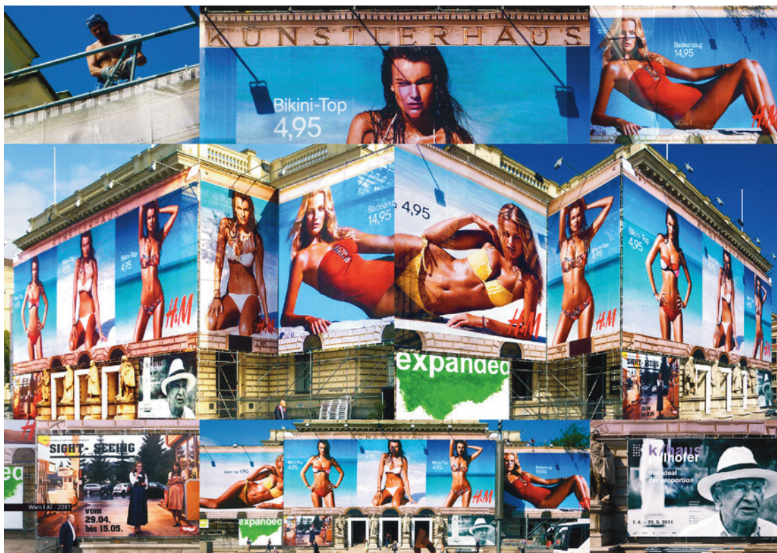
Die CALSI*-Sequenz , 2020 Lambda-Fotoausbelichtung, 50 x 74 cm

Material der für die Ausstellung WASTE ART entwickelten Tableaux sind Fotodokumente aus dem Bestand des Ewigen Archivs, das sich als „Enzyklopädie zeitgenössischer Wirklichkeiten“ versteht und von Peter Putz seit 1980 kontinuierlich aufgebaut und bearbeitet wird.