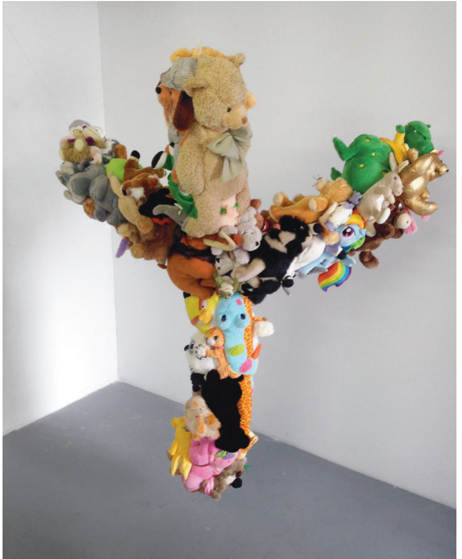
Lost love object , 2014 Objekt, 250 x 180 cm

Existiert undiszipliniert interveniert agiert skandiert spendiert reagiert inszeniert resümiert demontiert orientiert quittiert kommentiert kandidiert korrigiert res- uliert konstruiert produziert präsentiert definiert rea- giert suggeriert diskutiert akzeptiert verliert aktivier- tinterdiszipliniert konspiriert kollaboriert dekonstruiert- moniert kuratiert montiert finanziert selektiert inhal- liert komprimiert referiert signiert interagiert protes- tiert kontrolliert verliert kanidiert korrigiert blockiert gratuliert organisiert skizziert probiert explodiert ver- schmiert telefoniert kristallisiert reduziert moduliert phantasiert funktioniert beschmiert konzentriert ex- perimentiert transportiert zentriert sortiert uriniert differenziert sondiert marschiert programmiert dimen- sioniert subventioniert proportioniert integriert sta- tuiertraktiert vegetiert stagniert tituliert ungeniert standardisiert spezialisiert kontiert instrumentali- siert sterilisiert kulturinteressiert interpretiert kata- pultiert professionalisiert qualifiziert