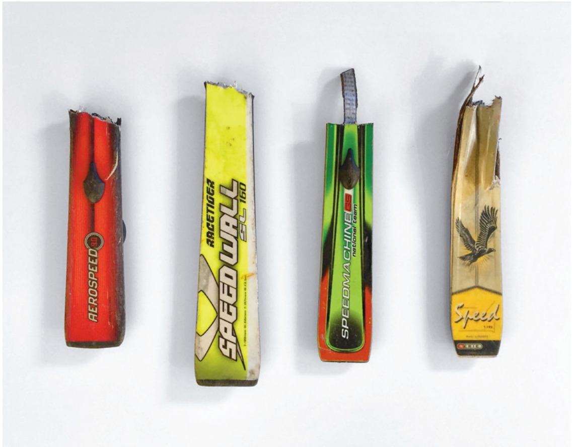
Après Ski – Speed , 2000 Objekte in Acrylbox, 96 x 71 x 6 cm

Nadine Olonetzky, NZZ 23. September, 2019