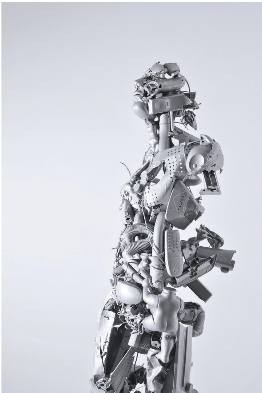
Figura leggera , 2017 Objekt mixed media assemblage, 165 x 43 x 45 cm