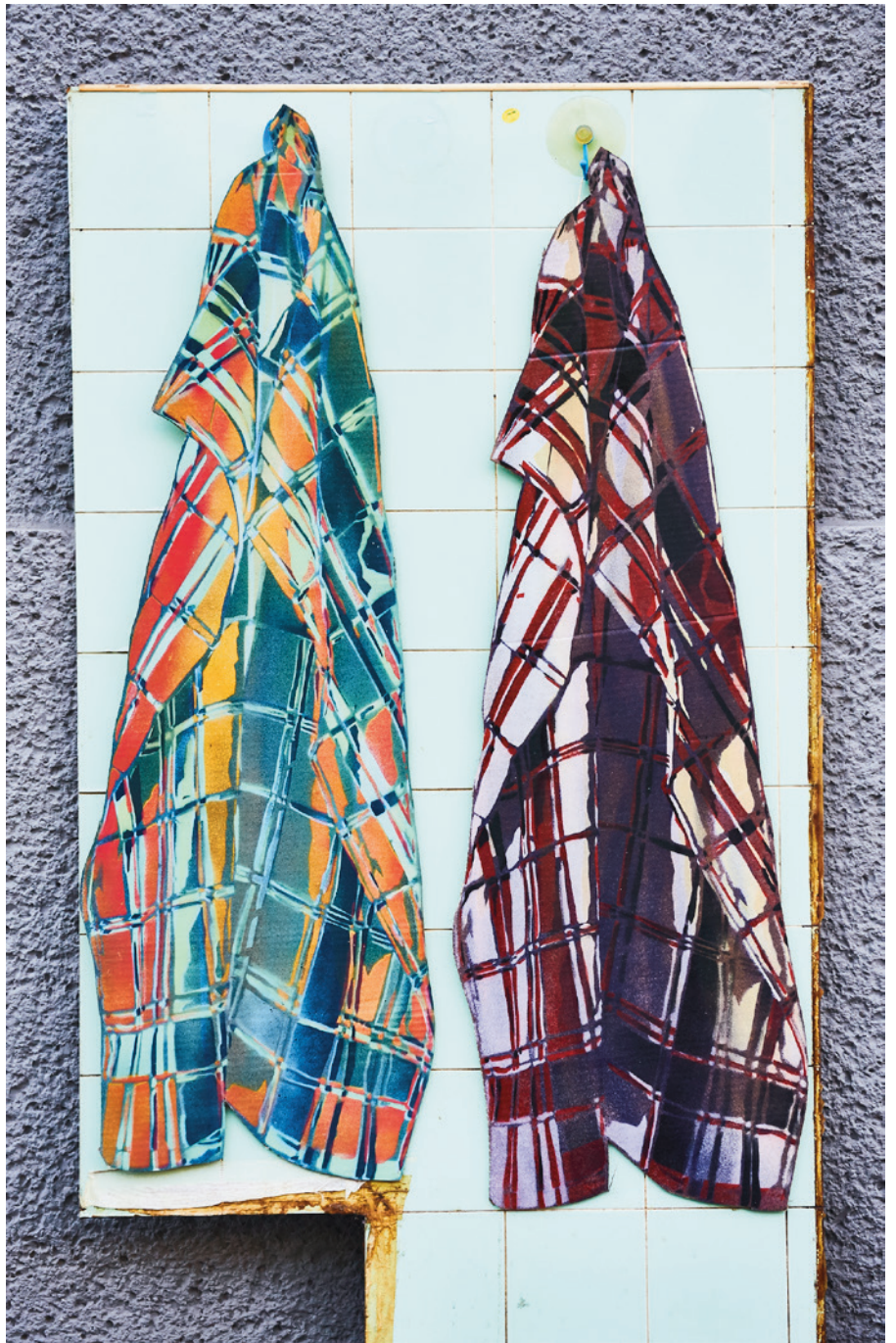
Abdeckung , 2019 Stencils auf Verpackung, Montage auf Kartonfliesenwand, 150 x 80 cm

Hans Glaser hingegen kümmert sich sehr um Schablonen. Die Linienführung dieser Schablonen verdankt sich dabei meistens fotografischen Vorlagen, die fotokopiert, ausgeschnitten und dann beliebig eingesetzt werden können als Auslassungsparkplätze für Sprühfarben - und dies über Jahre hinweg.