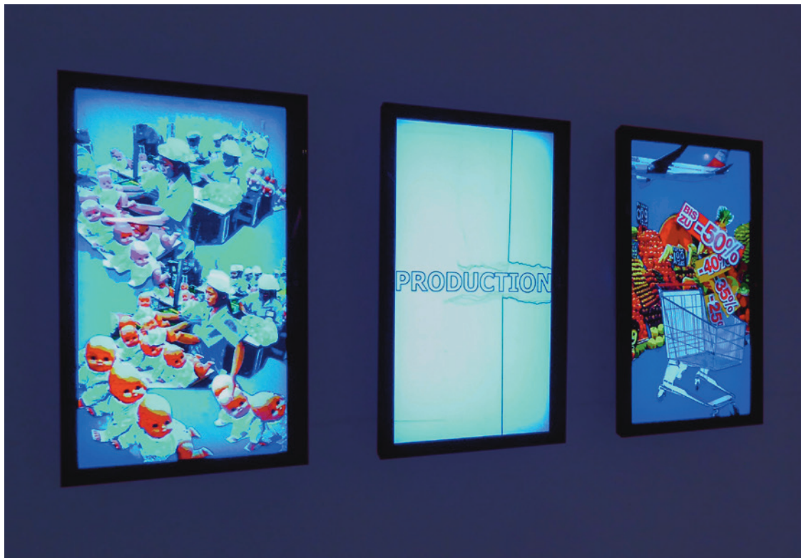
PARADOXON, 2012 Animation mit Ton, 10 min Installationsansicht