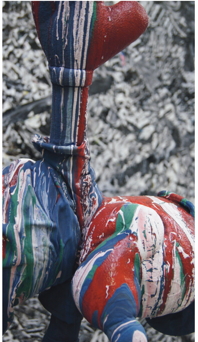
O.T., 2019 Objekt, Dispersion und Lack, 80 x 60 x 30 cm