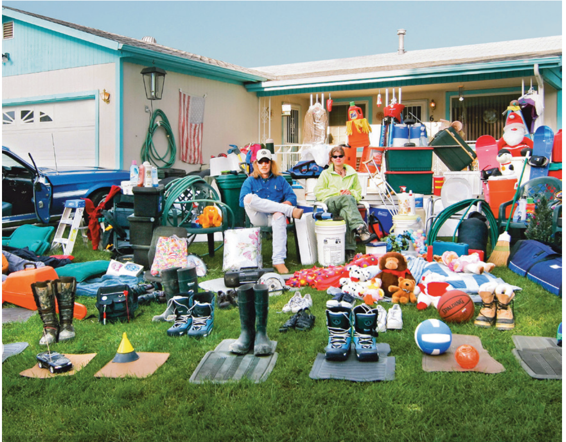
Hausausräumung , US, 2009 aus dem Film Plastic Planet 2009, Dokumentationsfilm, 1h39min

Plastik ist billig und praktisch. Wir sind Kinder des Plastikzeitalters. Kunststoffe können bis zu 500 Jahre in Böden und Gewässern überdauern und mit ihren unbekanntem Zusatzstoffen unser Hormonsystem schädigen. Wussten Sie, dass Sie Plastik im Blut haben?