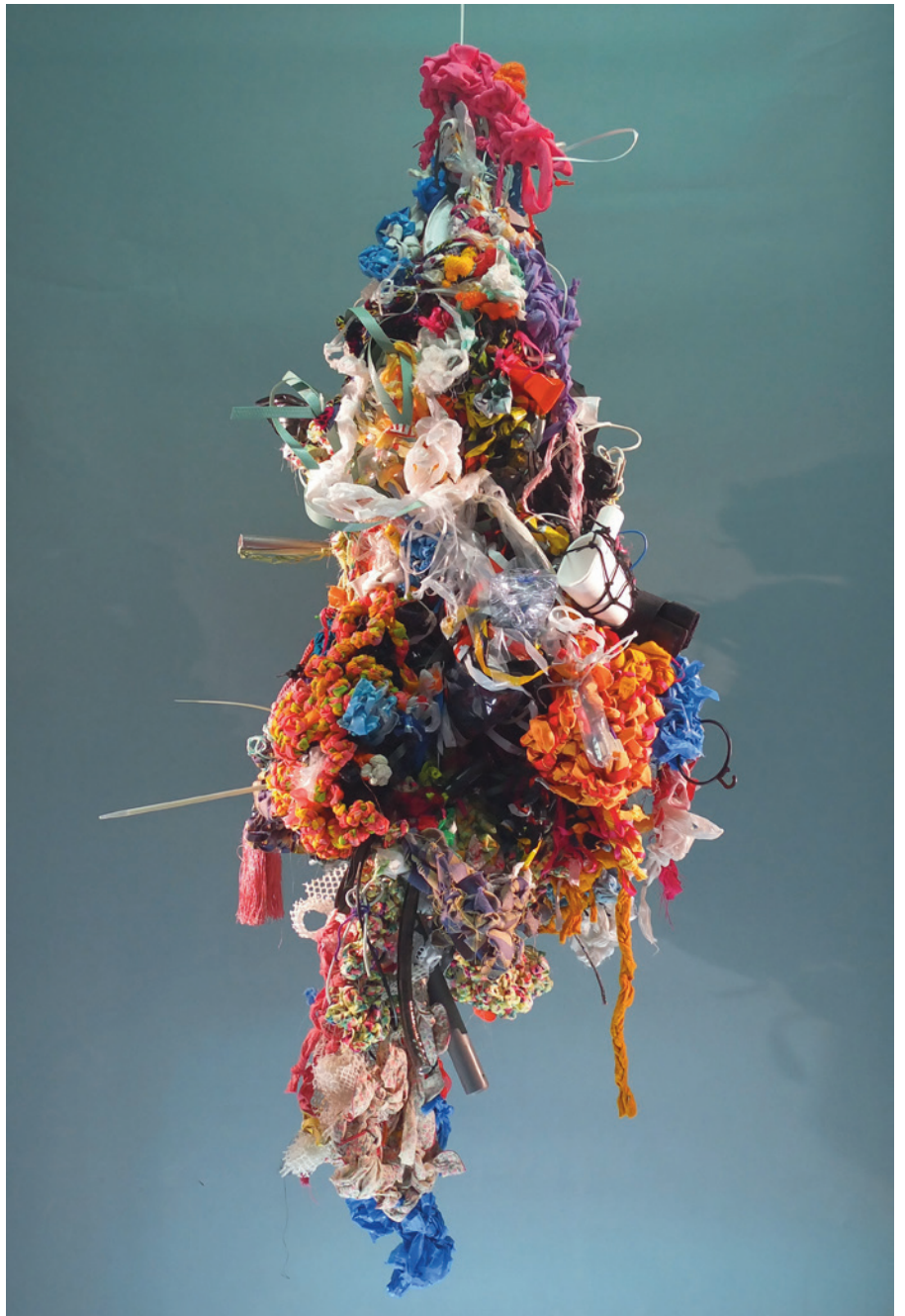
having it all. wanting more. , 2018 gebrauchte Textilien und Gegenstände, aus Kunststoff, Holz und Metall, 190 x 50 x 65 cm

noch ein T-Shirt / Pulli – der Roller / elektrisch – das Kastl – die Serviette – der Lampenschirm – Billy – billig – billiger. zwischendurch – schnell, schnell! – asiatisch – indisch, sonstwie – essen zum Wochenende – im Billigflieger – weil Zugfahren ist echt, echt, echt! zu teuer – nach Amsterdam – Berlin oder Lissabon. Die Haufen häufen sich. Ausgebeutet wird anderswo, und ach, mir geht es auch so schlecht.